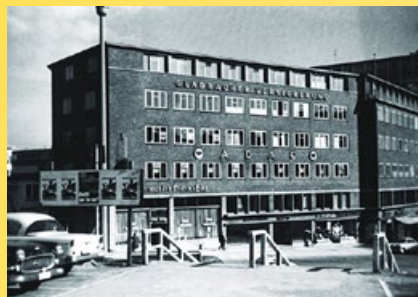
Bis 1948 Der ADAC hatte seine zweiten Büroräume in der Kieler Auguste-Viktoria-Straße