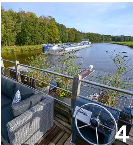
Urlaub im schwimmenden Ferienhaus Mal mit, mal ohne Führerschein