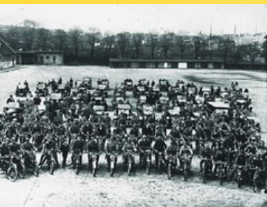
1924 Treffen der Motorradfahrer im ADAC auf dem Kieler Nordmarksportfeld