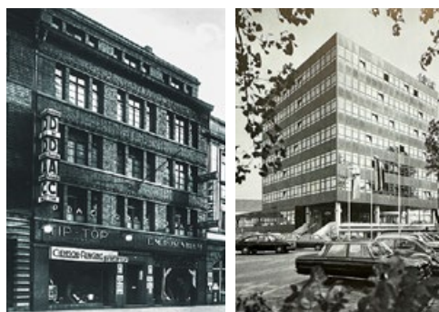
16 Jubiläen Wir sind da, seit 100 Jahren. Die ADAC Regionalclubs Schleswig-Holstein und Weser-Ems feiern 100-jähriges