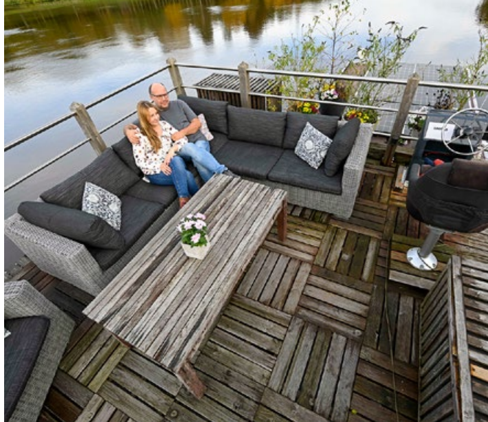
Entspannung An Bord der Alcedo ist viel Platz zum Relaxen, Lesen oder Vor-sich-hin-Dösen

Routen und Liegeplätze lassen sich gut über das Portal skipper.adac.de finden. Unter Hausboot-Urlaubern besonders beliebt ist die Mecklenburgische Seenplatte mit über 1000 zusammenhängenden Seen. Auf dem Portal deutschlands-seenland.de sind die Wasserwanderrastplätze, Marinas und Sportboothäfen jetzt zusammengefasst.