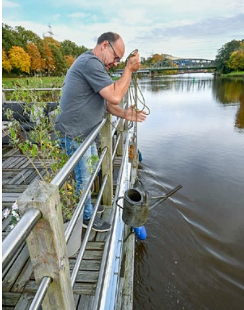
Klasse Detail Die Gießkanne hängt an einem langen Seil, um den Garten auf dem Oberdeck zu wässern