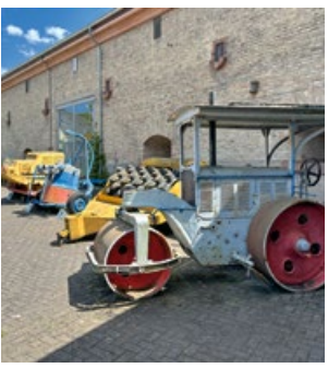
13 Das Straßenmuseum in Germersheim beleuchtet die Historie der Straße

Wir wünschen viel Freude beim Lesen! Ihre Redaktion