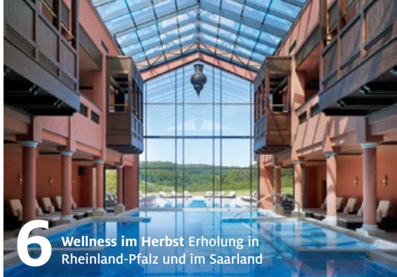
6 Wellness im Herbst Erholung in Rheinland-Pfalz und im Saarland