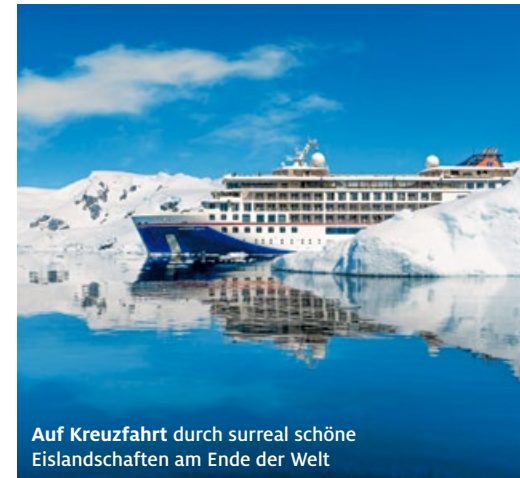
Auf Kreuzfahrt durch surreal schöne Eislandschaften am Ende der Welt

Am Dienstag, 23. September 2025, ab 18 Uhr entführt das ADAC Reisebüro Neustadt gemeinsam mit den Experten von Hapag Lloyd Cruises in die faszinierende Welt der Antarktis: majestätische Gletscher, schimmernde Eisberge und faszinierende Tierarten, darunter Pinguine, Wale, Robben, Seeelefanten, Seebären und eine Vielzahl von Seevögeln. Vorgestellt werden die kleinen Expeditionsschiffe, die bei der Kreuzfahrt durch die Antarktis abseits der ausgetretenen Pfade Anlandungen an unberührten Küsten und kleinen Inseln ermöglichen. Noch schöner als der Infoabend ist nur die Reise selbst.