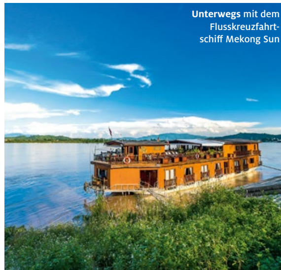
Unterwegs mit dem Flusskreuzfahrtschiff Mekong Sun