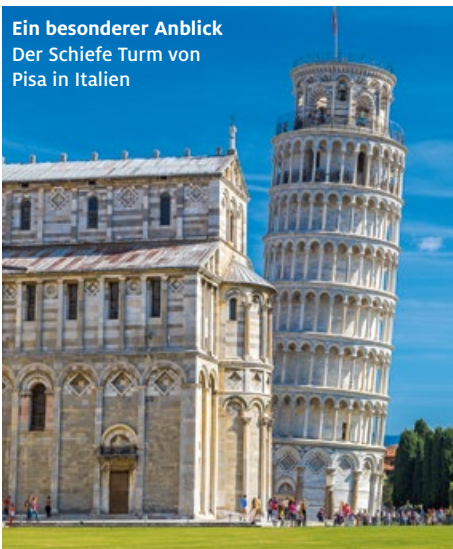
Ein besonderer Anblick Der Schiefe Turm von Pisa in Italien

› Weitere Informationen und Anmeldung auf adac-saarland.de/reise-touristik/kundenabend