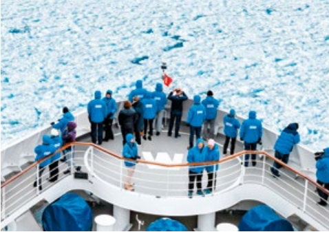
14 Tolle Aussichten Die ADAC Reisebüros laden zu Infoabenden ein