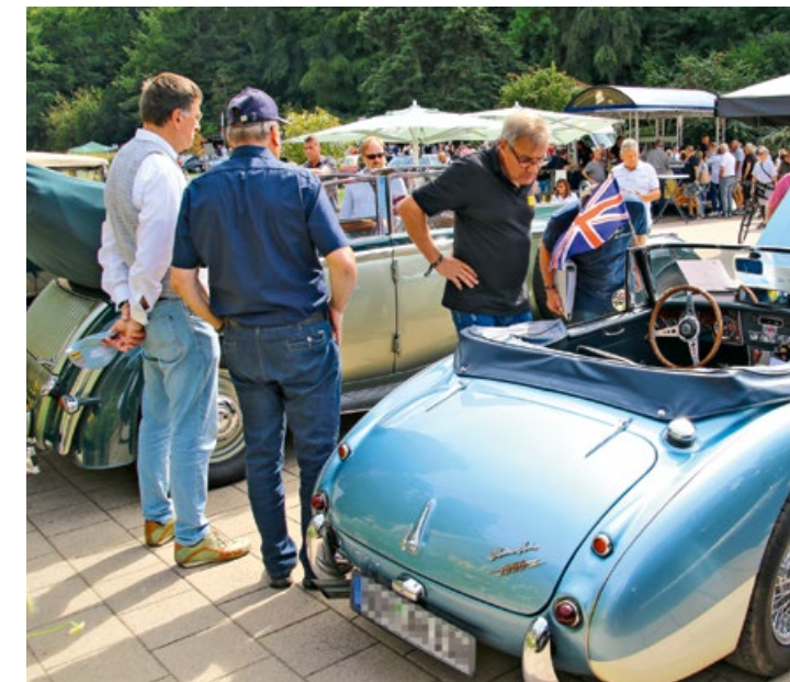
Der ADAC Oldtimertag in Homburg lockt im Sommer die Fans historischer Automobile ins Saarland

➤ Alle Infos auf adac-saarland.de/oldtimertag