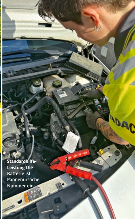
Standardhilfe-Leistung Die Batterie ist Pannennursache Nummer eins