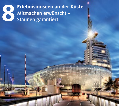
8 Erlebnismuseen an der Küste Mitmachen erwünscht – Staunen garantiert

Wir wünschen Ihnen viel Spaß bei der Lektüre!