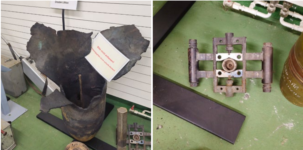
Originale des Einsatzes in Dresden 2018 Die teildetonierte, ausgebrannte Bombe sowie die verwendete Raketenklemme

Sekunde durch die Luft fliegen. Sicherheit für alle Beteiligten und Einwohner ist daher das oberste Gebot.“