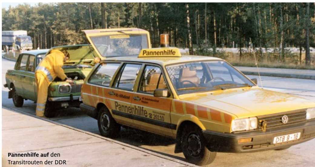
Pannenhilfe auf den Transitrouten der DDR