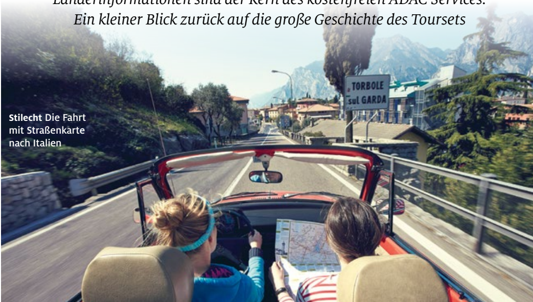
Stilecht Die Fahrt mit Straßenkarte nach Italien

Der persönliche Urlaubsführer Tourset feiert sein 50-jähriges Jubiläum und ist weiterhin sehr beliebt: Reisekarten, Urlaubsführer sowie Länderinformationen sind der Kern des kostenfreien ADAC Services. Ein kleiner Blick zurück auf die große Geschichte des Toursets