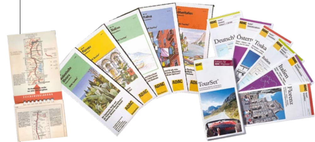
Evolution Das Layout des Toursets wurde im Zeitverlauf stetig weiterentwickelt

Zu Beginn der 1990er-Jahre wurde das Tourenpaket in Tourset umbenannt. Im Zuge dessen gab es außerdem eine inhaltliche und optische Überarbeitung. Zahlen und Fakten sowie eine bessere Lesbarkeit standen dabei im Vordergrund. Die Texte wurden knapper, die Attraktionen im Reise-land mithilfe von Nummern schneller auffindbar. Auch neue Themenrubriken wie „Kinder an Bord“ oder „Nachtleben“ kamen hinzu. Infolge wachsender Reiselust wurden die Fernziele Nordamerika, Australien und Neuseeland ergänzt. Die Nachfrage blieb hoch: Von 1975 bis 2004 wurde der Ferienbegleiter rund 57 Millionen Mal bestellt. Während anfangs die Reiseziele Italien, Österreich, Frankreich und Spanien die Abholstatistik anführten, stieg mit dem Mauerfall 1989 die Nachfrage nach innerdeutschen Zielen.