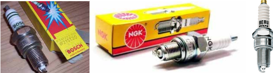
Zündkerzen von Marken-Herstellern

Identteile sind absolut bau- und funktionsgleich mit den jeweiligen Originalteilen. Hersteller ist der Kfz-Zulieferer, der gleichzeitig Lieferant des betreffenden Fahrzeugherstellers ist. Das Identteil wird nach denselben Kriterien und auf denselben Maschinen wie das Originalteil gefertigt - es fehlt das Logo der Fahrzeugmarke, stattdessen wird es unter dem Zulieferer-Markenzeichen vertrieben. Nach neuester Gesetzgebung ist der Begriff des Identteils überholt; diese Teile werden nun ebenfalls als Originalteile bezeichnet.