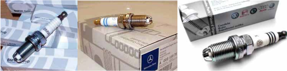
Original-Zündkerzen mit Hersteller-Logo

Originalteile werden mit dem Markenzeichen des Fahrzeugherstellers vertrieben. Unabhängig davon, ob die Fahrzeughersteller ein Autoteil selbst produzieren oder zugekauft haben, dürfen sie als Originalteil bezeichnet werden.